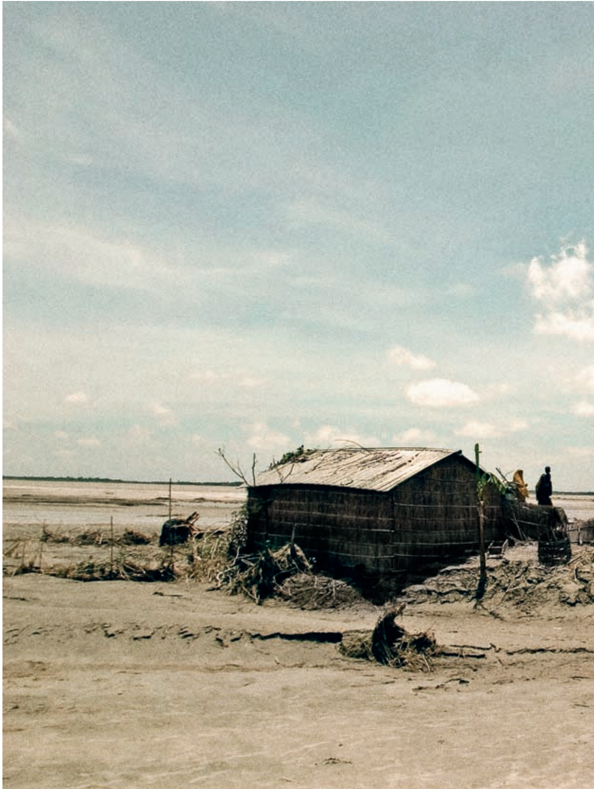
Fischer wie Rustam brauchen langfristigen Schutz vor Naturkatastrophen. Eine Mikroversicherung kann ihn gegen Schäden absichern.