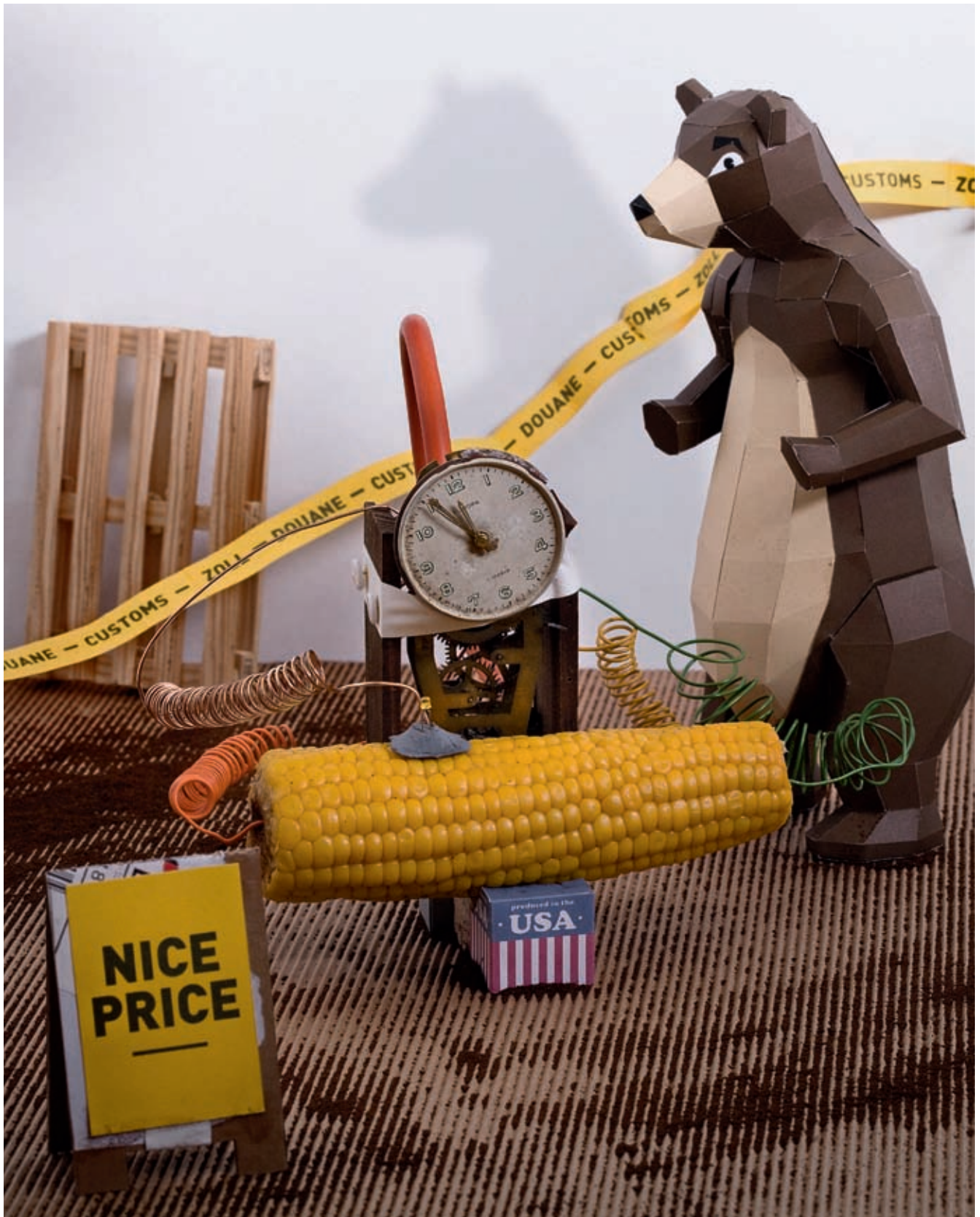
Auf dem Markt gibts nur Mais aus Nordamerika zu kaufen. Der ist zwar billig, doch er zerstört auch das Leben der afrikanischen Bauern. Angewidert dreht der Bär sich weg, mit Zeitbomben will er lieber nichts zu tun haben.