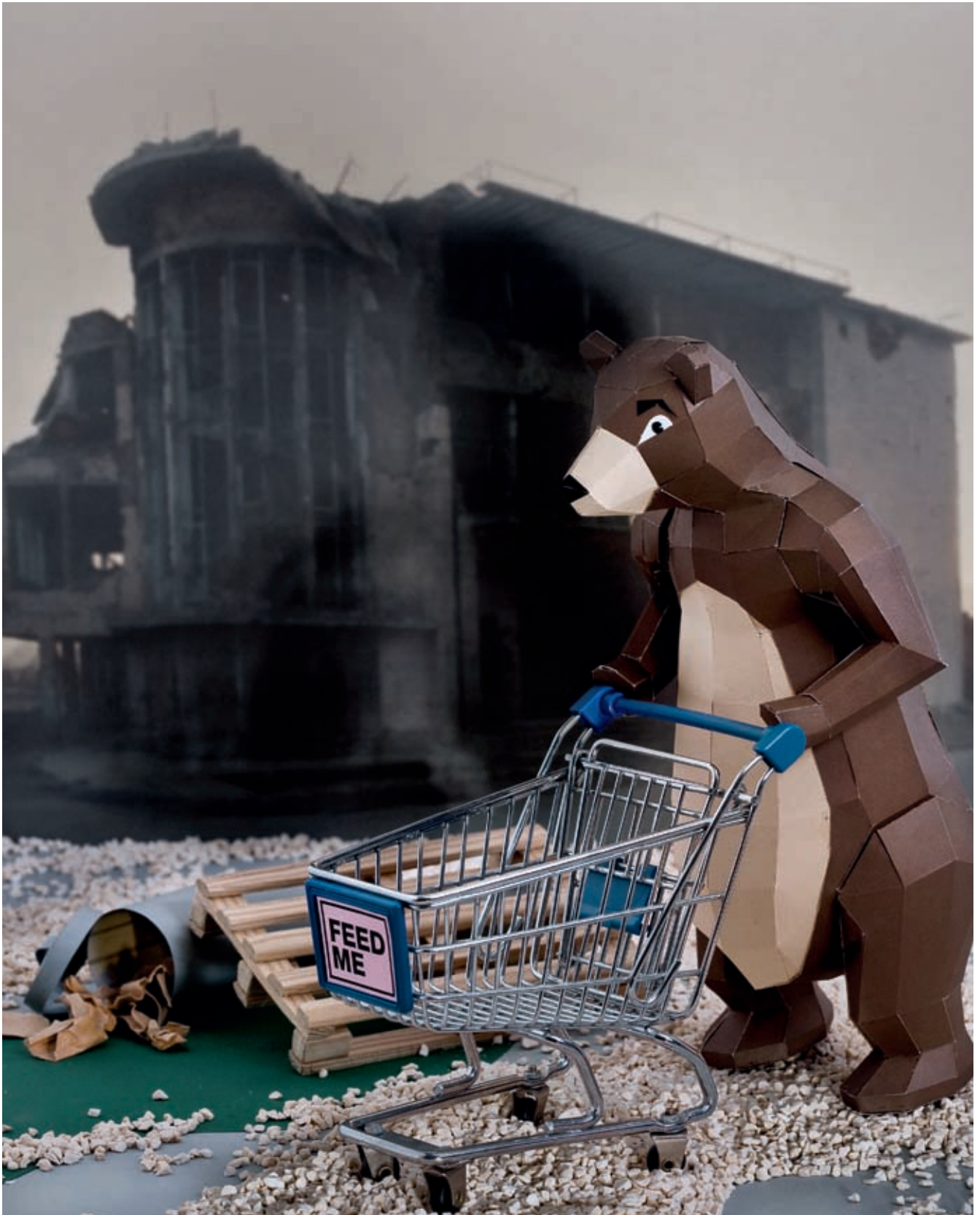
Der Magen hängt ihm zwischen den Kniekehlen, die Glieder sind schlapp, ermattet sucht er nach Essbarem. Er hat einen Bärenhunger, unser CARE-Bär.