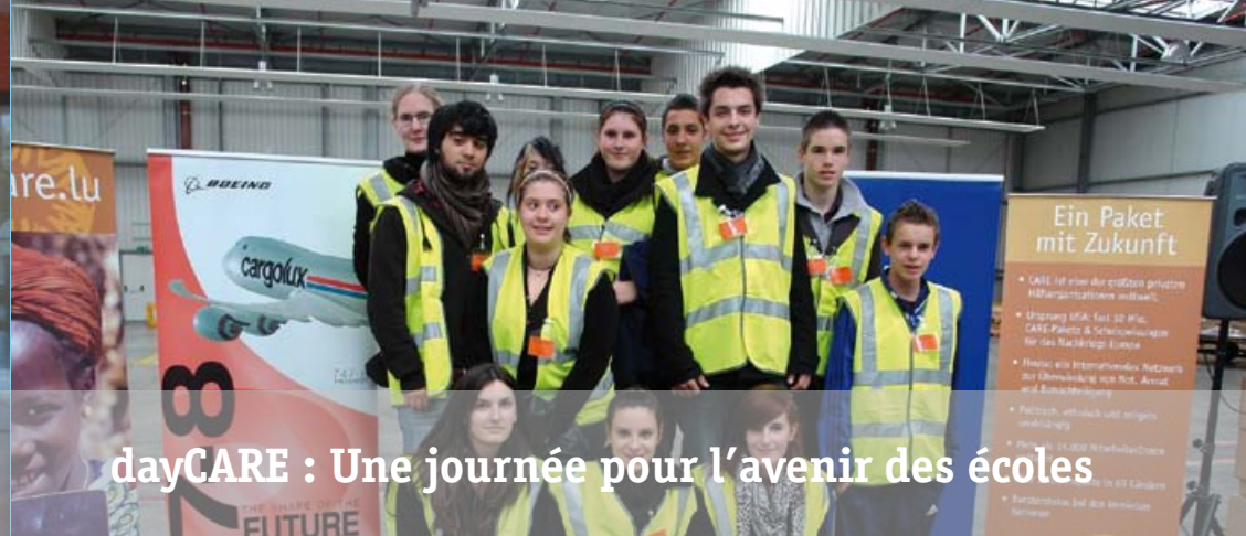
dayCARE : Une journée pour l'avenir des écoles

Vous souhaitez y participer ? N'hésitez pas à prendre contact avec l'équipe de CARE (Email : info-lux@care.lu ) et vos professeurs ! Vous pouvez consulter les offres disponibles actuellement dans la bourse de stage my dayCARE sur notre site internet : www.daycare.lu