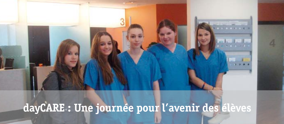
dayCARE : Une journée pour l'avenir des élèves